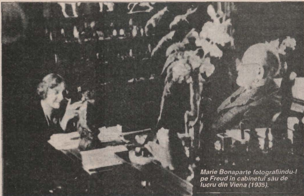
Marie Bonaparte fotografiindu-l pe Freud în cabinetul său de lucru din Viena (1935).

naliștii nu s-au purtat mai bine, Jacques Lacan criticînd "prestigiul său social" și denumind-o "bucătăreasă" și "cadavru ionescian". De altfel, Marie Bonaparte a trebuit să facă față unei ostilități "de principiu": nu era bărbat și nici medic, ceea ce, în perioada interbelică, era greu de "iertat", dar care, se pare, l-a sedus pe Freud.