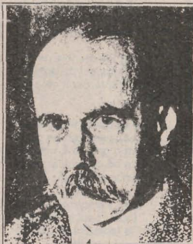
Max Wertheimer (1880-1943), fondatorul psihologiei gestaltiste

aici, preconiza introducerea unei euristici productive de tip gestaltist.