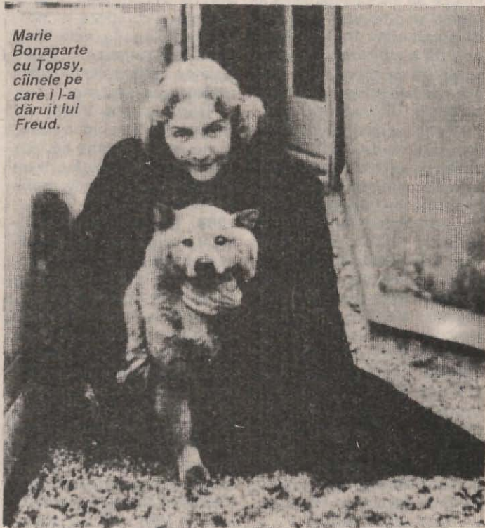
Marie Bonaparte cu Topsy, cîinele pe care i l-a dăruit lui Freud.

Psihanalistă și filosemită, excomunicată din pricina căsătoriei cu un prinț ortodox, George al Greciei și Danemarcei, prințesa Marie Bonaparte era o figură aparte în mediul aristocratic și catolic al vremii, iar viața pe care a dus-o (a avut mai mulți amanți, printre care, în "anii nebuni", și Aristide Briand) a contribuit la excluderea sa din societate. Nici psiha-