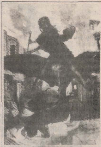
Ciurma (1898), de Arnold Böcklin

Se constată teme recurente. Frica de Altul, de moarte, spectrul epidemiilor etc. Ruperea ordinii instituite, însoțind istoria, deschiderea spre necunoscut, spre viitor nasc angoasă, cristalizată în frică. Incertitudinea vieții este transformată în imaginarul