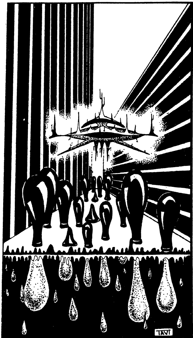
Desen de Șerban Octavian

— Vreau să vă anunț că raftul nr. 64 s-a ocupat.