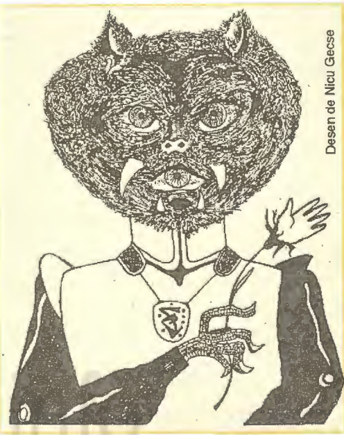
Desen de Nicu Gece

Gomoniul sunt hăituiți de frică, dar nici unul nu renunță. Speranțele lor au renăscut de la