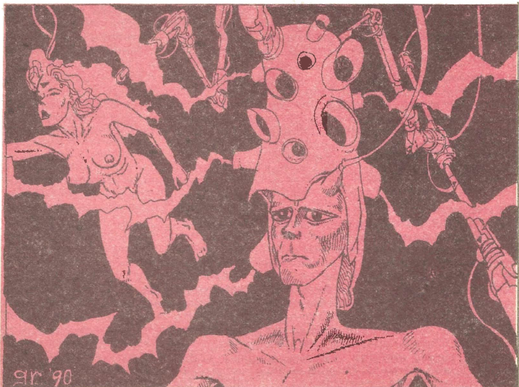
Desen de RADU GAVRILESCU

Cred că am un fel de teamă combinată cu un gen de gelozie. Vreau să renunț la orgă și la filtrele colorate. Cred că-l voi convinge.