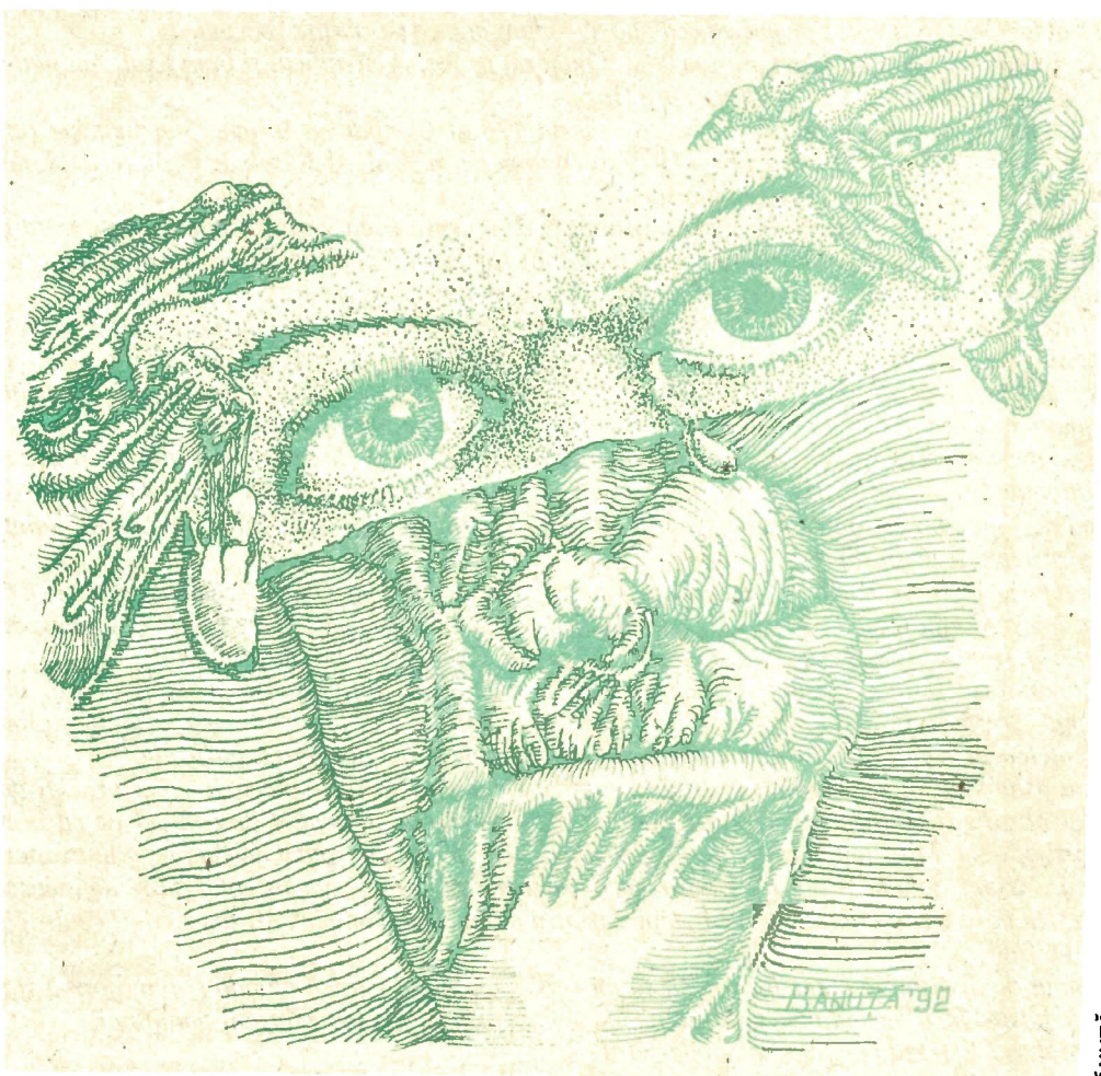
Desen de IONUȚ BĂNUȚĂ