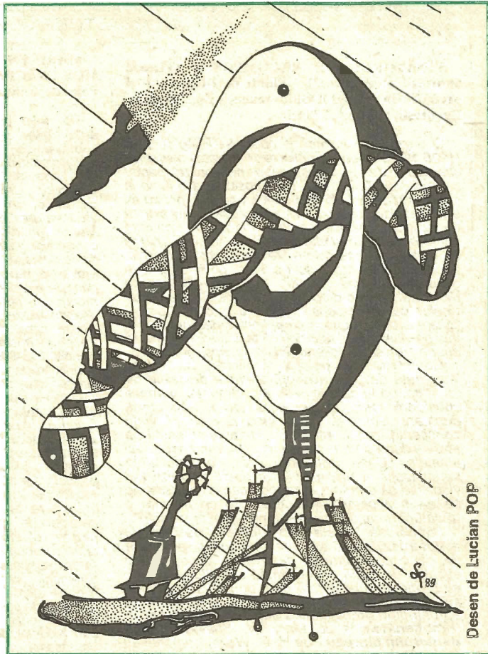
Desen de Lucian POP

Prinul nepot. Primele clipe de liniște. Las munca, privesc lumea și mi se pare