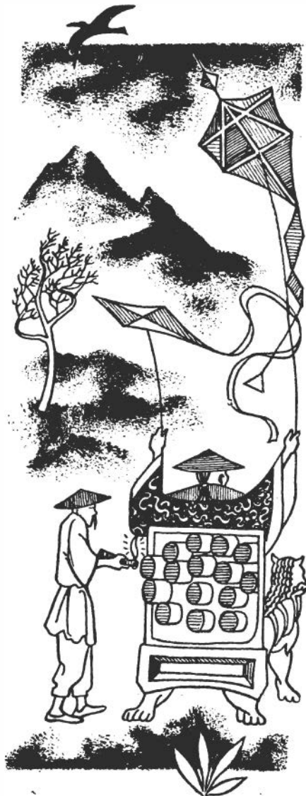
După desenul lui Dumitru Ionescu din volumul „Asaltul Cosmosului” de Dumitru Andreescu (Editura tineretului, 1964)

De fapt, în China rachetele încep a fi folosite nu numai la focuri de artificii sau pentru acțiuni de luptă. Prima încercare de construire a unui vehicul pro-