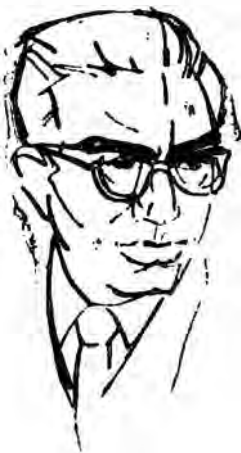
Desen de TIA PELTZ.

Stăteam lângă catafalcul poetului, cutremurat de această sfișietoare și absurdă fringere în plin zbor. Îmbibat de acorduri funebre, acru din încăperea căpătase parcă o altă consistență, strin-