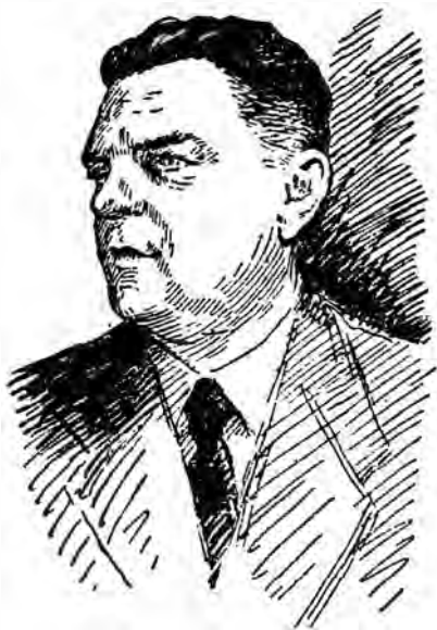
Ivan Antonovici Efremov

Ai impresia că de pe ochi și se desprinde un văl, și deodată privești de-a dreptul în străfundul timpurilor, iar viața contemporană a omului vine în contingență cu trecutul de mult dispărut și totuși atât de palpabil...”. Aceste cuvinte îl exprimă extrem de bine pe Efremov: savant și filozof, dar mai curînd savant și poet, căci cine altcineva