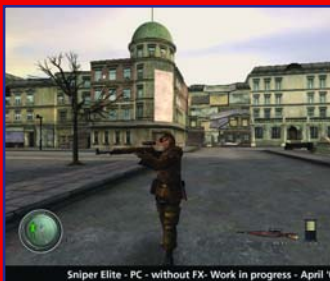
Sniper Elite - PC - without FX: Work in progress - April '03