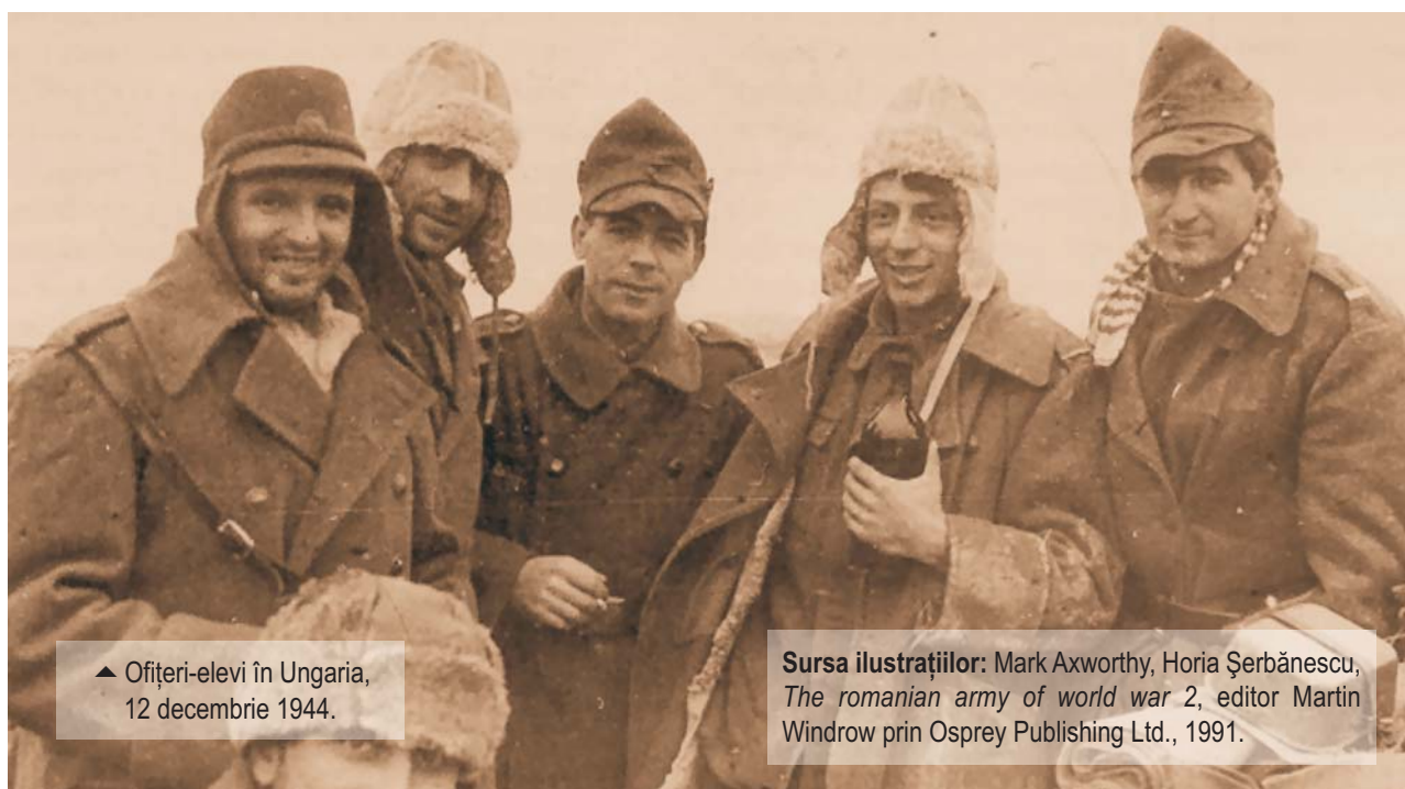
▲ Ofițeri-elevi în Ungaria, 12 decembrie 1944.

[8] Florin Constantiniu, O istorie sinceră a poporului român , Editura Univers Enciclopedic, București, 1997, p. 447.