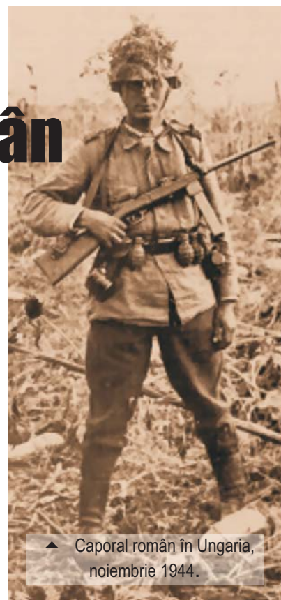
▲ Caporal român în Ungaria, noiembrie 1944.

Armata 4 română, încadrată inițial la flancul drept de Armata 7 de gardă sovietică, apoi de Armata 40 sovietică, iar la flancul stâng de Armata 27 sovietică, a acționat ofensivă pe direcția generală Luduș, Bonțida, Jibou, Carei, pătrunzând rapid,... prin „Poarta Someșului”,