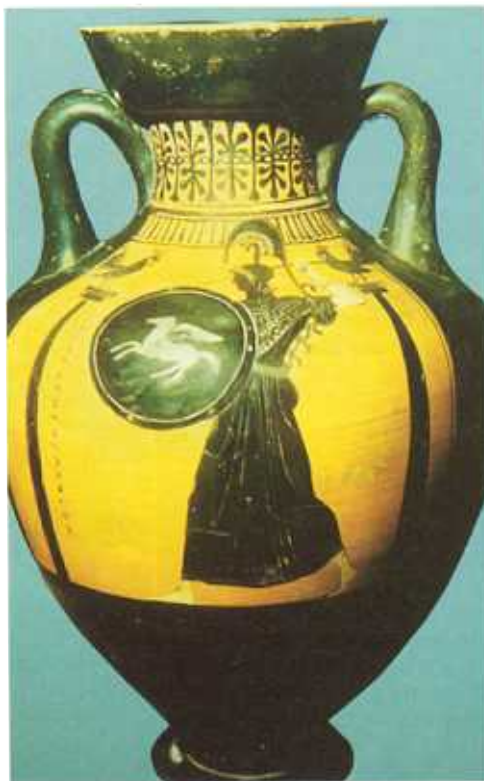
Ancient Art and Architecture Collection

⦿ Atena ținând în brațe un scut cu chipul lui Pegas. Acesta era un cal înaripat născut din sângele Meduzei.