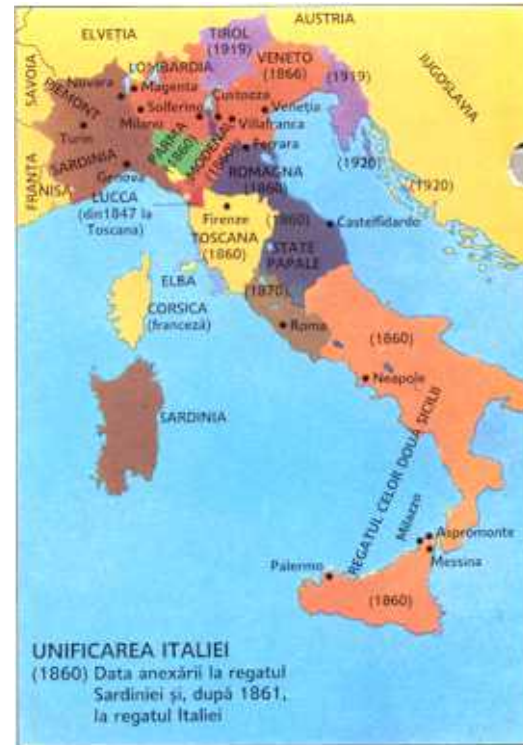
▲ Înainte de unificare, Italia era un amestec de state și provincii austriece.