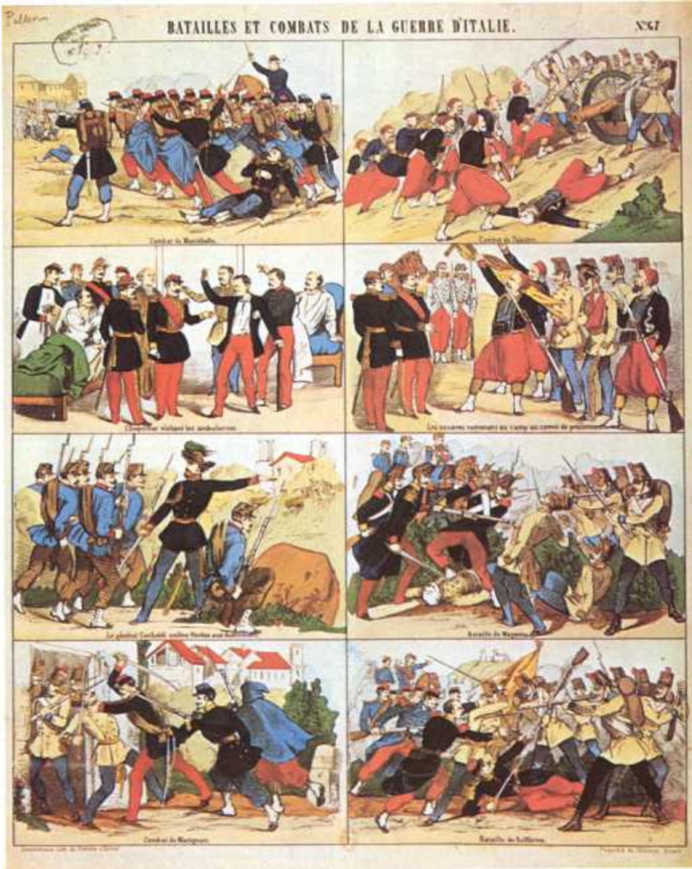
Editions Robert Laffont