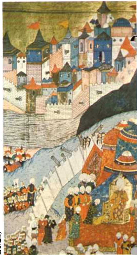
▲ Budapesta asediată de Soliman, într-o miniatură din secolul XVI. După bătălia de la Mohács din 1526 marea parte a Ungariei, inclusiv Budapesta, a căzut în mâini otomane.

După o scurtă perioadă de bunăstare în secolul XVIII, în Imperiul Otoman s-a instalat un declin ireversibil. În secolul XIX, viitorul vastului Imperiu Otoman devenise o problemă internațională denumită de britanici "Chestiunea Orientală".