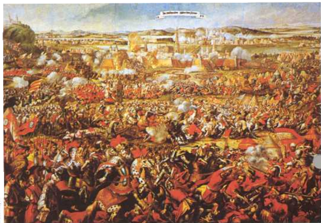
● Asediul fără succes al turcilor asupra Vienei, 1683. În 1699, austriecilor li s-au restituit toate pământurile ungare prin pacea de la Karlovitz.