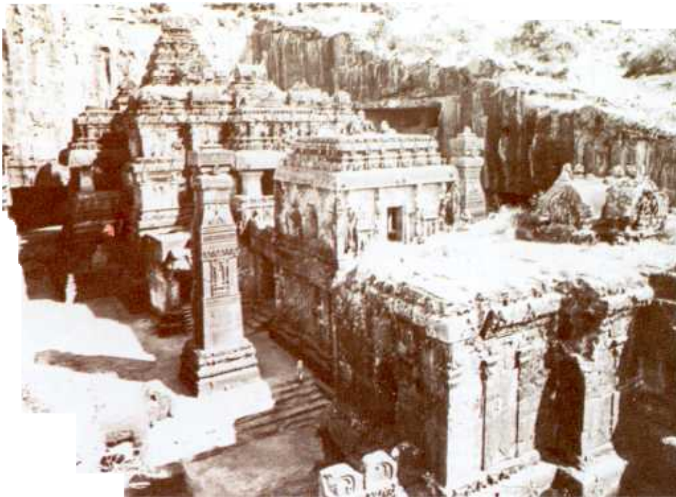
India Office Library

⦿ Cel mai minunat monument al artei dravidiene din secolul VIII-lea, templul din Kailasa. Secole de-a rândul a fost loc de pelerinaj pentru hinduși, jainiști și budiști.