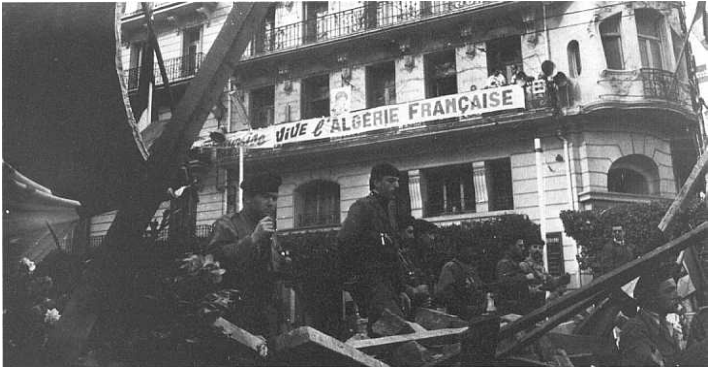
John Hilleison Agency