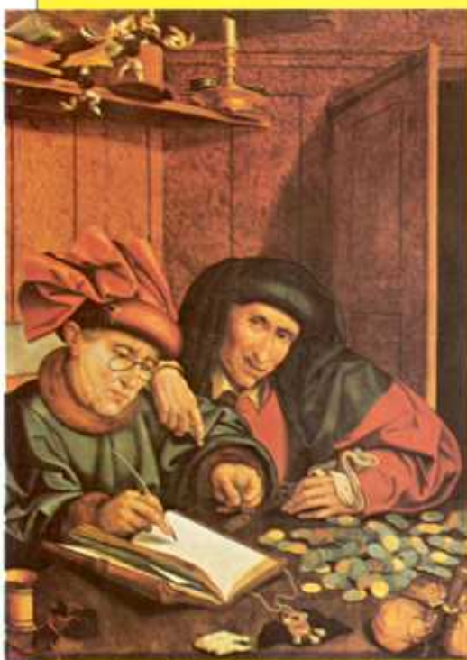
Negustorii de bani, reprezentați (stânga) într-o pictură din secolul 16, se îmbogățeau, datorită tranzacțiilor financiare tot mai sofisticate. Jos: metoda de a bate monede de argint în secolul 18. Dezvoltarea comerțului necesita aprovizionări adecvate cu argint. Prelucrarea aurului și argintului (dreapta) era un factor important al revoluției comerciale din secolele 16 și 17.

În timpul acestei perioade de 250 de ani, populația Europei a crescut, iar orașele au înflorit. Cele mai mari expansiuni urbane se înregistrau în principalul centru comercial al fiecărei țări – Amsterdam, Londra, Paris. În general, celelalte orașe din aceleași țări rămâneau surprinzător de mici, porturile franceze ca Nantes, Bordeaux și Marseille fiind excepții. Creșterea populației în Londra a fost fenomenală: până în 1700; acesta a fost cel mai mare oraș din Europa, cu aproximativ 600000 mii locuitori, iar până în 1800, a ajuns la 900000, aproape dublul parizienilor – lucru remarcabil, ținând cont că populația Marii Britanii era doar o treime din cea a Franței.