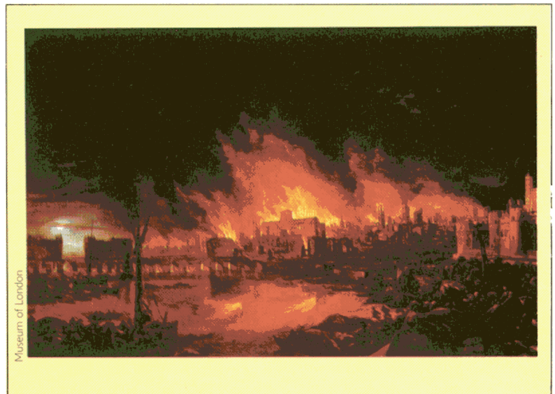
Museum of London