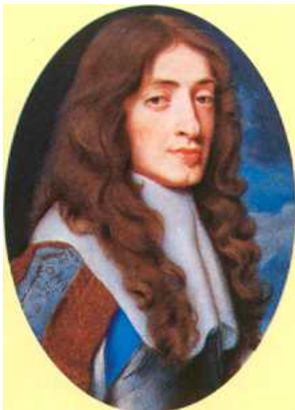
Victoria and Albert Museum

☛ După numai cinci ani de la restaurarea lui Carol al II-lea, Anglia a fost bântuită de ciumă. Un an mai târziu, în 1666, marele incendiu din Londra a lăsat peste 100.000 de oameni fără case – dar a distrus și zonele afectate de ciumă.