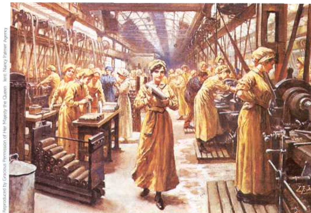
Reproduced by Gracious Permission of Her Majesty the Queen.

Uniunea Politică și Socială a Femeilor condusă de Emmeline și Christabel Pankhurst a susținut cu devotament eforturile făcute pentru război. Ani de-a rândul sute de femei au lucrat în fabrici de armament. Cu munca lor efectuată în timpul primului război mondial, sufragetele au obținut o recunoaștere generală.