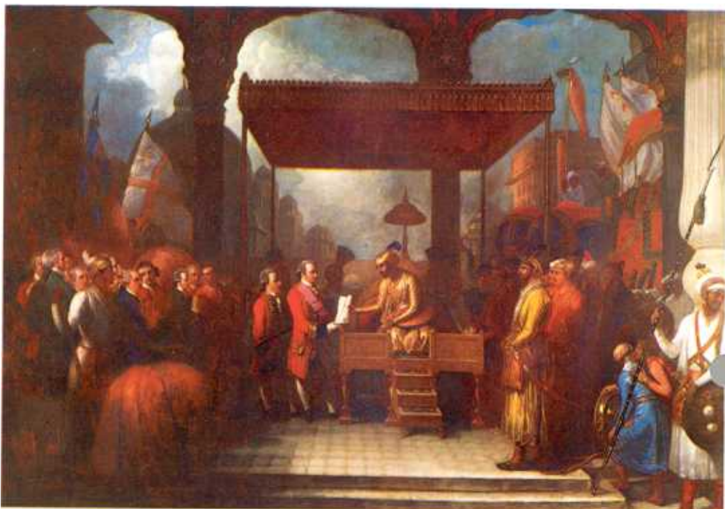
India Office Library

● Robert Clive, cel care a instaurat conducerea engleză în India, primește din partea Companiei India de Est dreptul de a colecta și administra veniturile Bengalului.