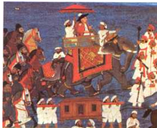
Victoria & Albert Museum

Locuitorii din Mahratta și Afganistan s-au luptat unii împotriva altora până la epuizare, puterea revenind în cele din urmă în mâinile englezilor. Însă, în timp ce puterea lor a slăbit