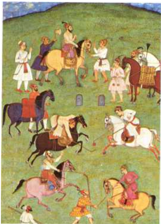
● Pictură din secolul al XVII-lea reprezentând prinții din dinastia Moghul jucând polo. Jocul a fost adus din Persia.