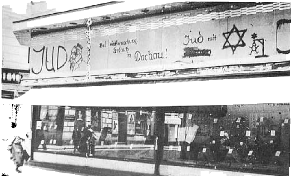
Hulton Deutsch Collection

▶ Obscenități anti-evreiești pe fațada unui magazin din Viena. Proprietarul risca să fie dus în lagăr, dacă le ștergea.