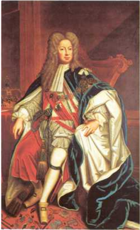
London Features International

De-a lungul secolului al XVIII-lea Marea Britanie a avut perioade lungi de stabilitate întrerupte doar de amenințări temporare cum au fost rebeliunile iacobite. Prosperă și puternică, această țară a devenit o mare putere imperială și a declanșat prima revoluție industrială a lumii.