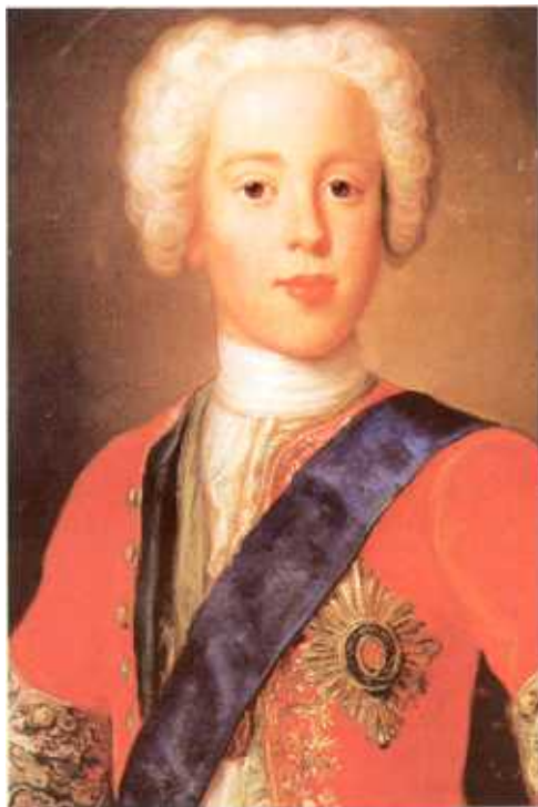
National Portrait Gallery

▶ Prințul Charles Edward Stuart. Pentru susținătorii săi din Highlands era "Prințul Charlie cel Frumos". Oponenții săi îl numeau "tânărul pretendent".