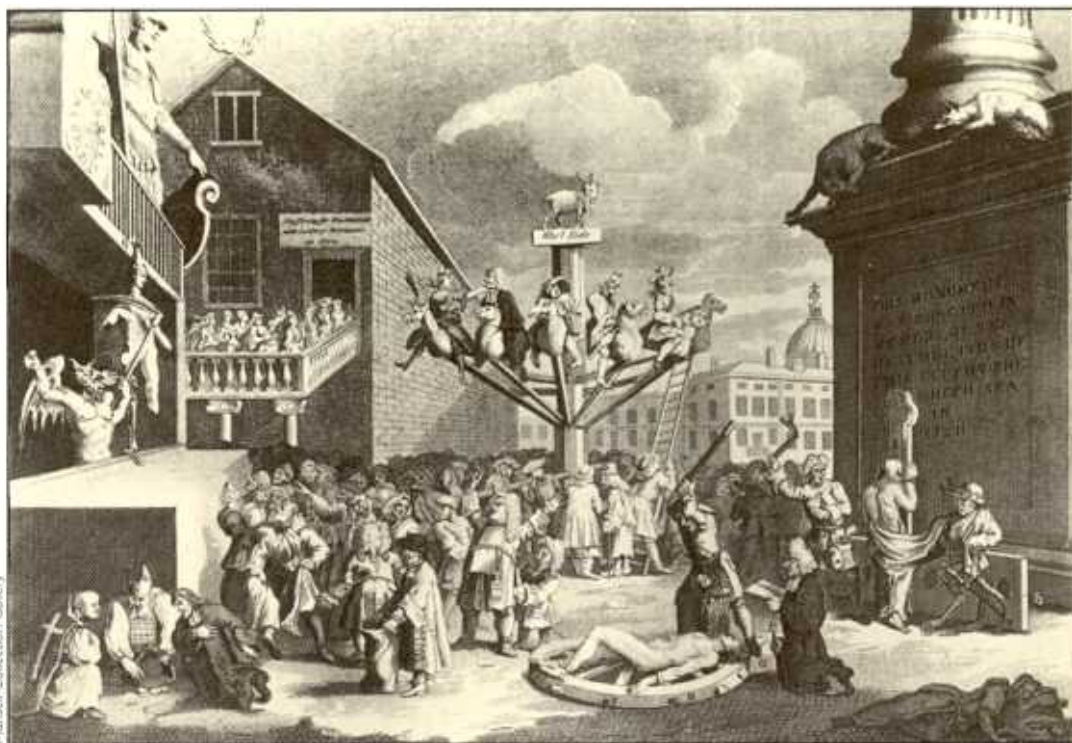
Mansell Collection Gallery

Criza l-a adus în prim plan pe Robert Walpole, care adesea e numit cel dintâi prim ministru britanic; el a condus fiecare ramură a administrației într-un mod cu totul nou. Walpole nu a tolerat existența rivalilor în Parlament; prin priciperea cu care s-a ocupat de alegeri și de membri parlamentului a reușit să asigure o majoritate de încredere în Camera Comunelor. Metodele sale au fost deseori criticate, dar s-au dovedit a fi un mijloc eficient de a menținere și susținere a guvernului, în condițiile inexistenței unui sistem politic disciplinat. Un factor decisiv l-a constituit folosirea "poziției" și protecției – Coroana îi recompensa pe cei ce se dovedeau prieteni, adică loiali, și pe prietenii prietenilor cu posibilitatea de a se întâlni cu persoane importante de la orice nivel, de la mari funcționari ai statului până la funcționarii punctelor vamale locale. Deși puțini membri ai Parlamentului erau "cumpărați" pe față, cei mai mulți au decis că era în interesul lor să susțină Guvernul în majoritatea problemelor. În timpul lui Walpole acest mod de abordare a devenit o adevărată artă și a format baza aranjamentelor politice de la sfârșitul secolului XX.