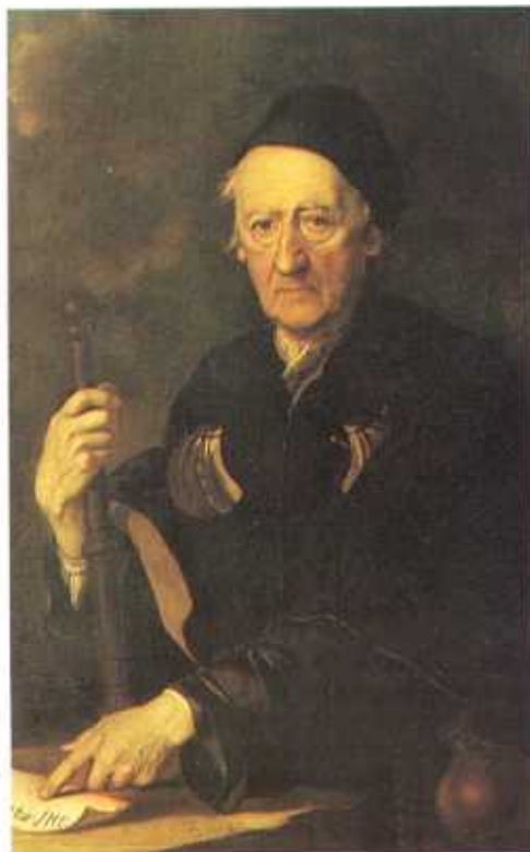
Royal Geographical Society

Considerând clima acceptabilă, au început să se îndrepte încet și spre interiorul continentului.