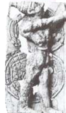
French Archaeological School, Athens

Coifulurile războinicilor micenieni erau confecționate din bronz sau colți de mistreți puși laolaltă astfel încât să așeze de lovitură. Doar regii și nobilii purtau armuri ce acopereau tot corpul.