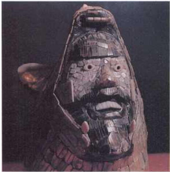
🕒 Mayașii construiau centrele de cult cu o exactitate matematică. Templul capitalei, Chichen Itza (la dreapta) a fost dedicat firosului Quetzalcoatl, al cărui cap chiar apare din gura deschisă a Pământului (sus).

Dintre civilizațiile americane cunoscute cea mai veche este a olmecilor din Mexicul de Est. Centrul său se afla într-o zonă de pădure tropicală mlăștinoasă – de neînțeles de ce pe acest teritoriu ostil au construit imense centre de cult asemănătoare unor orașe cu movile de pământ artificiale uriașe, pe vârful cărora odinioară se aflau temple.