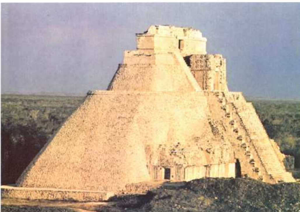
🕒 Templu mayaș construit în stilul clasic târziu în 987 e. n. în Uxmal în Mexic. Aceste construcții serveau ca centre de cult.

Cu toate dimensiunile lor mari, aceste centre nu erau orașe adevărate, deși în timpul ceremoniilor religioase se adunau aici o mare mulțime de oameni, dar locuitorii permanenți nu puteau fi mai mulți de câteva sute de preoți și slugile lor.