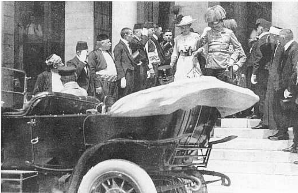
● Arhiducele și ducesa Austriei ieșind din primăria orașului Sarajevo în Bosnia, înainte de asasinarea lor pe 28 iunie, 1914. Aceasta a dus la un război sârbo-austriac și, șase săptămâni mai târziu, la Primul război mondial.

(1856), după un război în Crimeea (1854-1856) în care Rusia a fost înfrântă de Marea Britanie și Franța. Al doilea acord a încercat să evite un război general și a fost încheiat în cadrul Congresului de la Berlin (1878).