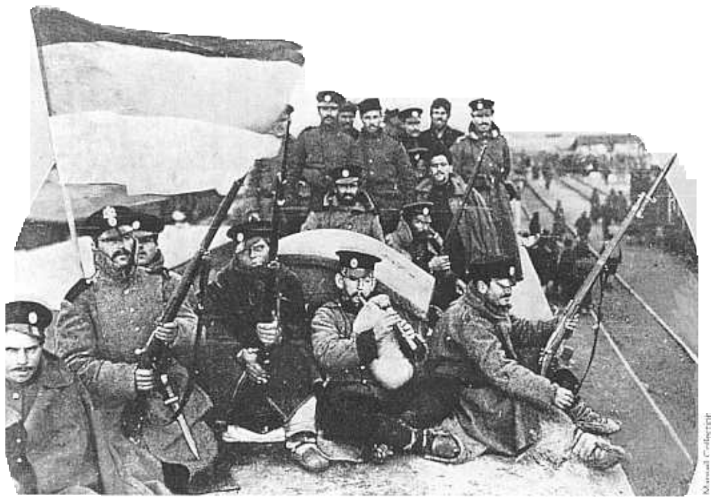
▲ Soldați într-un tren bulgar în drum spre front în Primul război balcanic din 1912. Liga balcanică, formată din Grecia, Bulgaria, Serbia și Muntenegru i-a alungat în cele din urmă pe turci din Europa.

Începând cu jumătatea secolului XIX, Rusia a obținut două victorii importante asupra Turciei, impunându-i acesteia condiții dure, care au fost în cele din urmă revizuite de celelalte puteri europene. Acest lucru a fost prima dată făcut prin pacea de la Paris