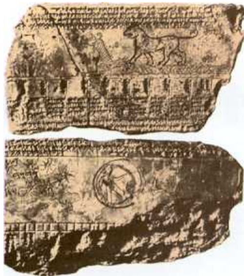
Staatliche Museum, Bern

☉ Tăbliță reprezentând Babilonul în centrul discului pământului inconjurat de apă.