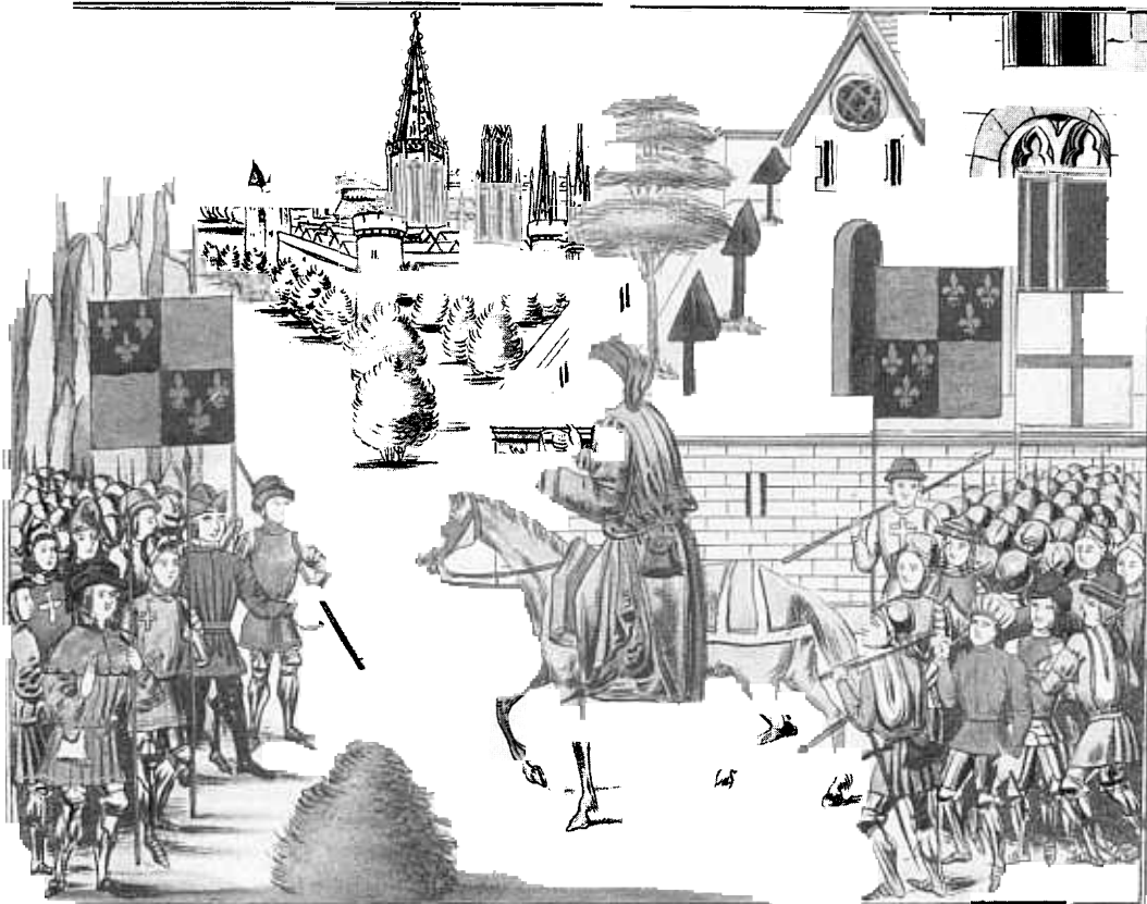
▼ John Ball conducând Răscoala țăranilor din 1381. Mii de țărani au mărșăluit prin Londra, distrugând toate registrele feudale.