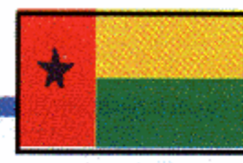
Senegal Gambia Guinea Guinea-Bissau