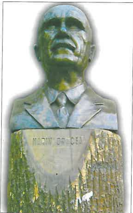
Foto 3. Bustul lui Marin Drăcea aflat la Institutul de Cercetări și Amenajări Silvice, operă a profesorului Emil Negulescu.

Sugestivă este afirmația potrivit căreia „se judecă economia forestieră după înălțimea soarelui, după latitudine, după sol și după climă și se ignoră faptul că cel mai puternic factor care hotărăște soarta pădurii este omul, care foarte multă vreme a fost ignorat, dar cu toate acestea, secole întregi a continuat să submineze economia forestieră și pădurea. Și atunci apare acest mare adevăr, că centrul de pre-