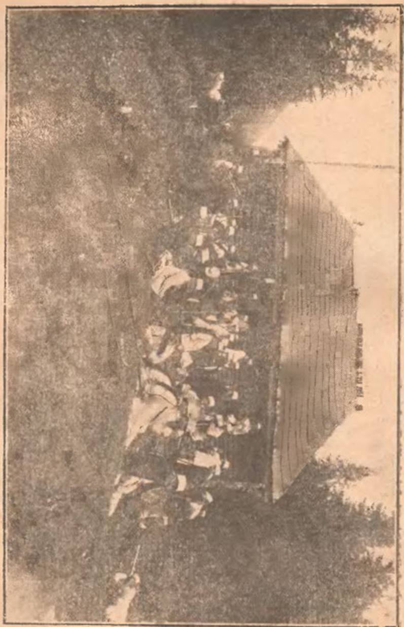
Fig. 1. Stând aproape de limita vegetațiunii forestiere pe Muntele Miru-mare.