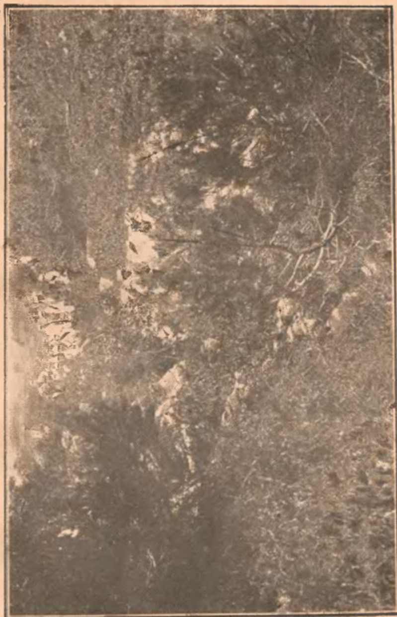
Fig. 2. Tuterișe de Jneapân pe Negoii.