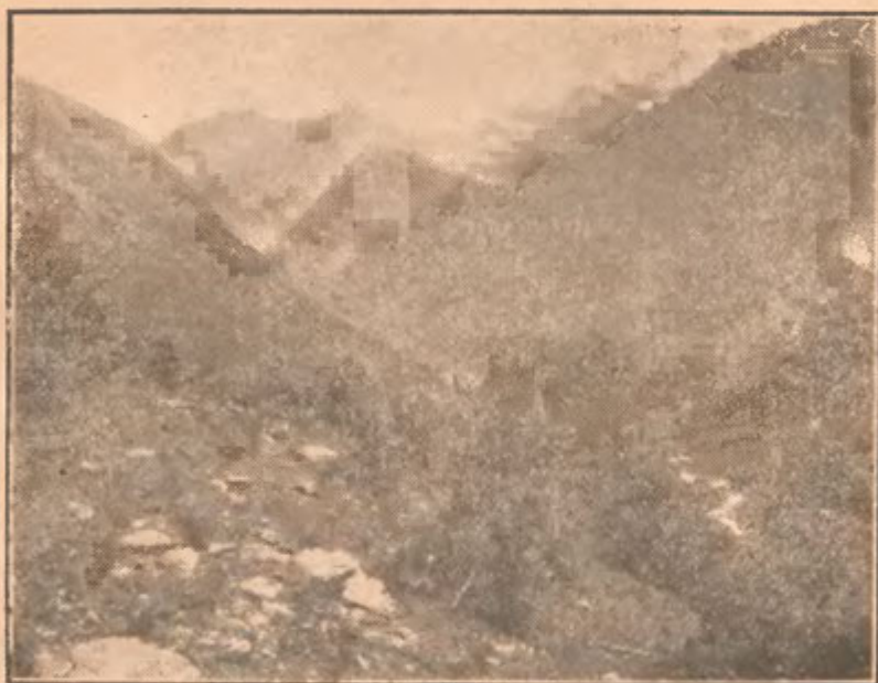
Fig. 3. În golul muntelui, pe Negoia.

alocuri ne ajutăm la urcat cu frânghia. Din pricina lungimei și greutatei drumului, hotărâm s'o tăiem d'a dreptul peste munte, spre a trece pe Lespezi. Poteca e nesigură ; trecem pâraie gălăgioase și ne afundăm într'un desiș de jneapăn în care poteca dispăre. Ne rătăcim. Ne târâm pe sub trunchiurile sucite și încurcate ale Jneapănului. Un Sorbus aucuparia , a cărui sămânță a fost adusă aci, cine știe de unde, de vreo pasăre, se ridică frumos d'asupra desișului. Doar prin strigăte prelungite mai ținem legătura unii cu alții. În sfârșit scăpăm de aci și prin