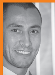
Paul ROMAN Exchange Server and Collaboration